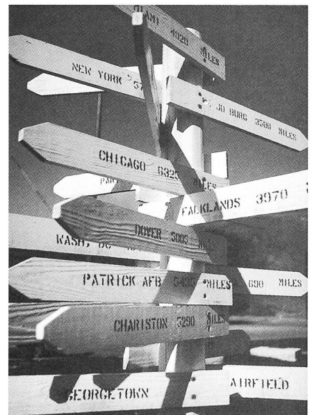
Fig. 2. «Agence de voyage».

zone d'observation, où il ferait encore nuit lors de l'occultation mais avec la Lune déjà bien dans le ciel, c'était dans l'Atlantique Sud.