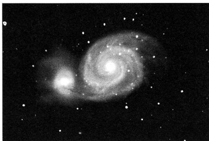
Observatoire des Creusets à Arbaz 10