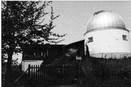
Einblick in die Spektralklassifikation 4