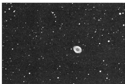
La CCD? Mais c'est très simple!