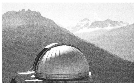
Observatoire François-Xavier Bagnoud