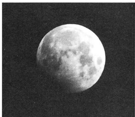
Tiefe Halbschatten-Mondfinsternis fast partiell