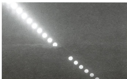
Sonnenuntergang / ROBERT NUFER - 26