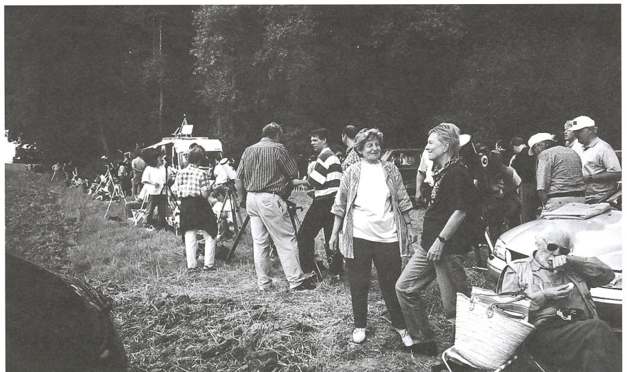
Fig. 2: les télescopes installés, l'attente fébrile commence.

A 11 h 16, le premier contact n'est pas observable.