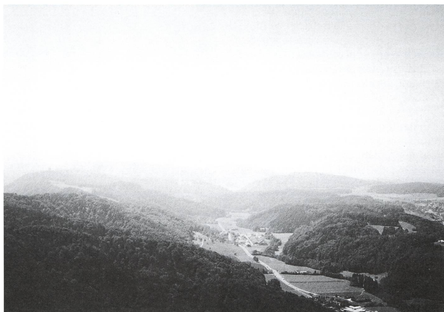
Fig. 1. Ausblick vom Uetliberg bei Zürich, 25.6.1998, mittags. Mit zunehmender Entfernung vom Standort des Photographen erscheinen Flächen immer mehr aufgehellt. Die Helligkeitsunterschiede zwischen aneinander grenzenden Objekten bzw. Objektflächen werden mit zunehmender Distanz geringer, was einer Kontrastabnahme entspricht.

Beim Vorgang des Sehens und der Wahrnehmung reagiert das Auge des Menschen auf kleine Helligkeitsunterschiede, die zwischen den Grenzflächen verschiedener Objekte bestehen. Ein bestimmtes Objekt kann mit seinen Umrissen nur dann optisch als Einheit identifiziert werden, wenn es sich durch einen Helligkeitsunterschied von seiner unmittelbaren Umgebung abhebt. Massgebend