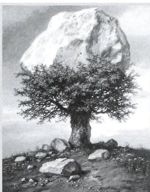
The art of Ludek Pesek - 15