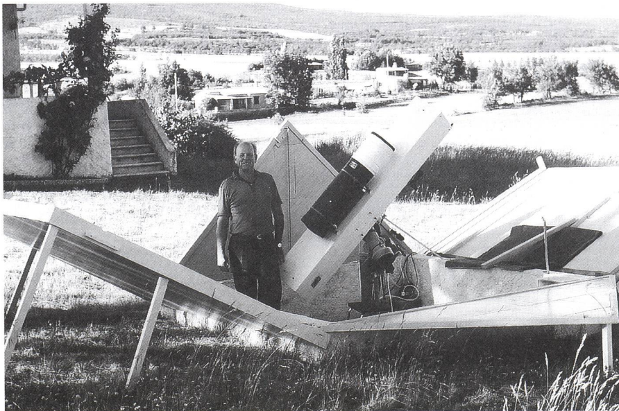
Fig. 1. Die Klapphütte mit dem 21-cm Newton und der 20/22/30-cm Schmidtkamera