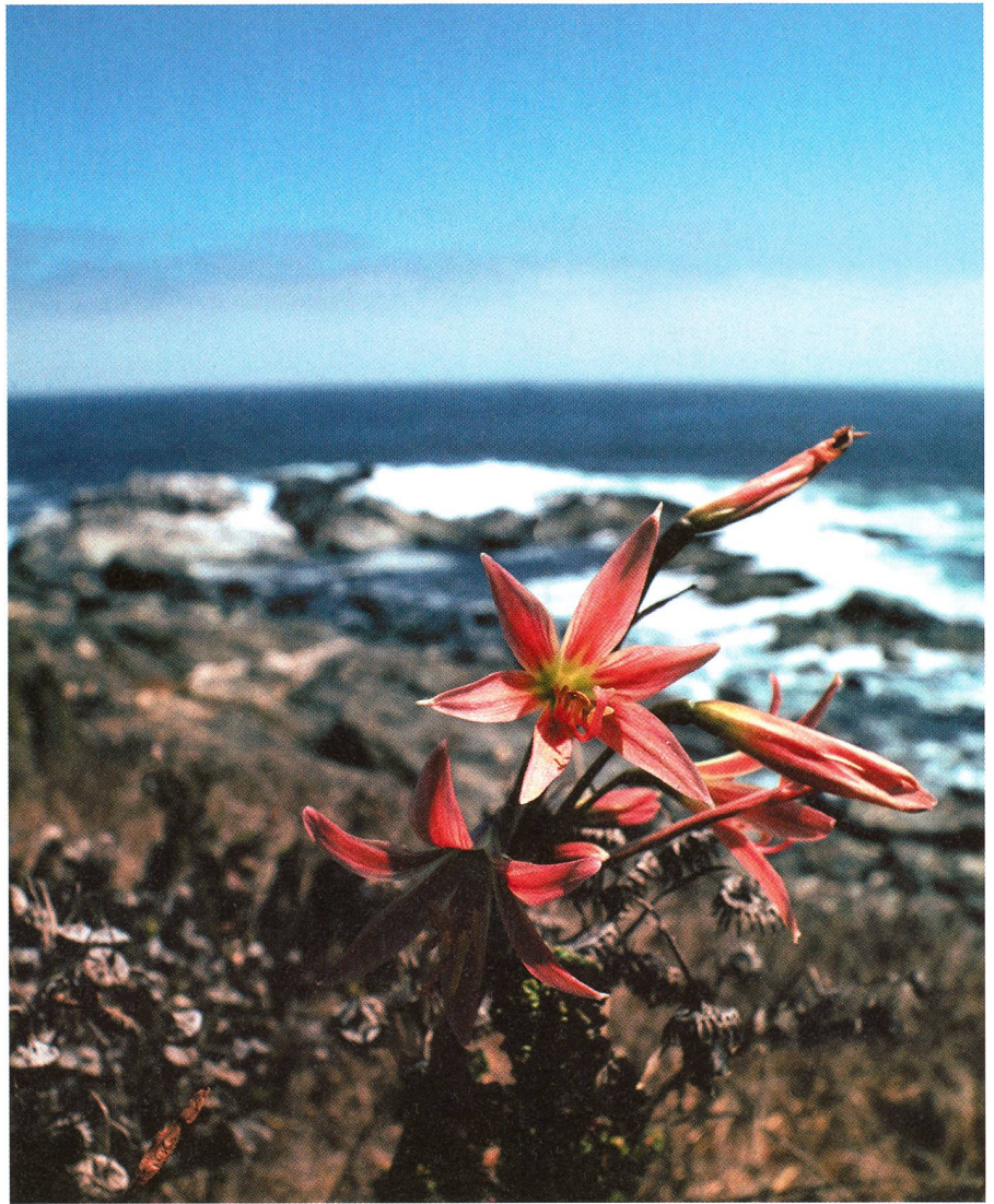
Issues du sable

Quelques astronomes et philosophes proposent même que l'Univers et ses lois de la physique auraient été créés dans le seul but de permettre l'apparition de la vie. Des coïncidences entre des seuils de réactions nucléaires, et des valeurs critiques à la formation par nucléosynthèse d'autres éléments indispensables à la vie peuvent intriguer. De même que l'apparente «justesse» des constantes universelles peut surprendre (HOYLE 1994). Les partisans les plus extrêmes de ce «principe anthropique» vont même jusqu'à suggérer que l'Univers aurait été créé dans le seul but d'assurer notre avènement. Ces arguments