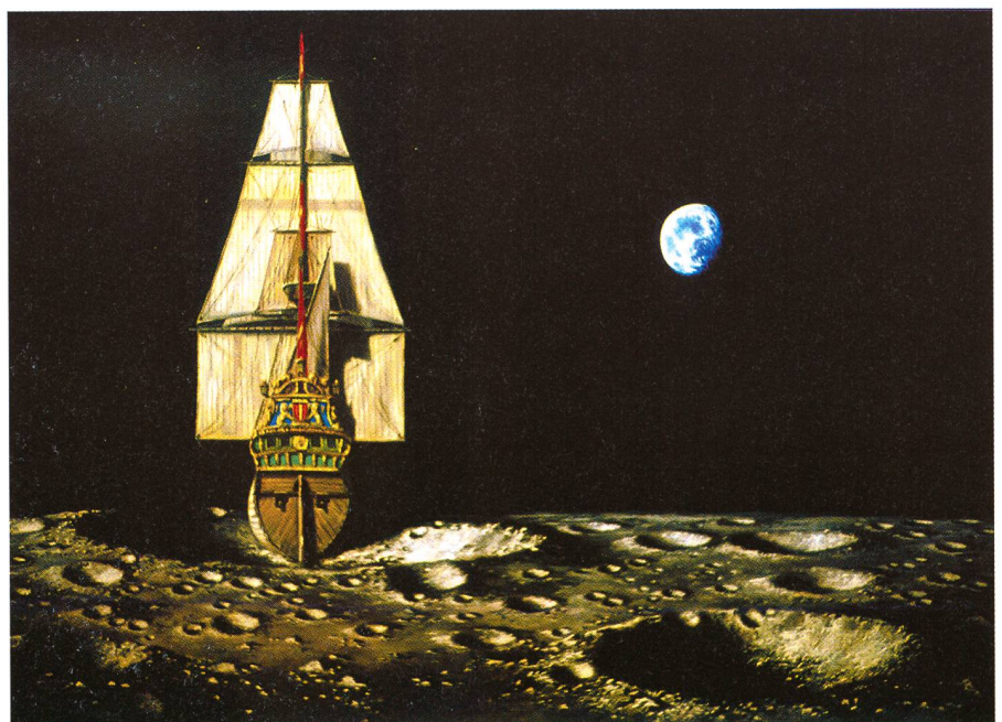
Grands navigateurs (huile de LUDÉK PESEK)

L'étoile la plus proche est à presque quatre années et cinq mois de lumière. Huit mille fois plus éloignée que Pluton. Un vide immense, incomparablement plus étendu relativement aux quelque quatre mille kilomètres d'océan qui emprisonnent notre habitant de l'Île de Pâques. Bien que la Science Fiction ait déjà abondamment défriché le terrain avec de nombreuses explorations virtuelles de l'étoile Alpha du Centaure, nous ne savons pratiquement rien de cette «proche» voisine si ce n'est qu'elle est double et que les deux soleils du système sont peu différents du nôtre. Il est inconcevable d'aller se rendre sur place, ni même d'y envoyer une sonde automatique qui effectuerait le voyage en un temps raisonnable (une vie humaine). Toute l'information dont nous disposons est contenue dans la lumière que nous en recevons. A fortiori aussi des quelque deux cents milliards d'autres étoiles dispersées bien plus loin dans le grand disque de notre galaxie, la Voie