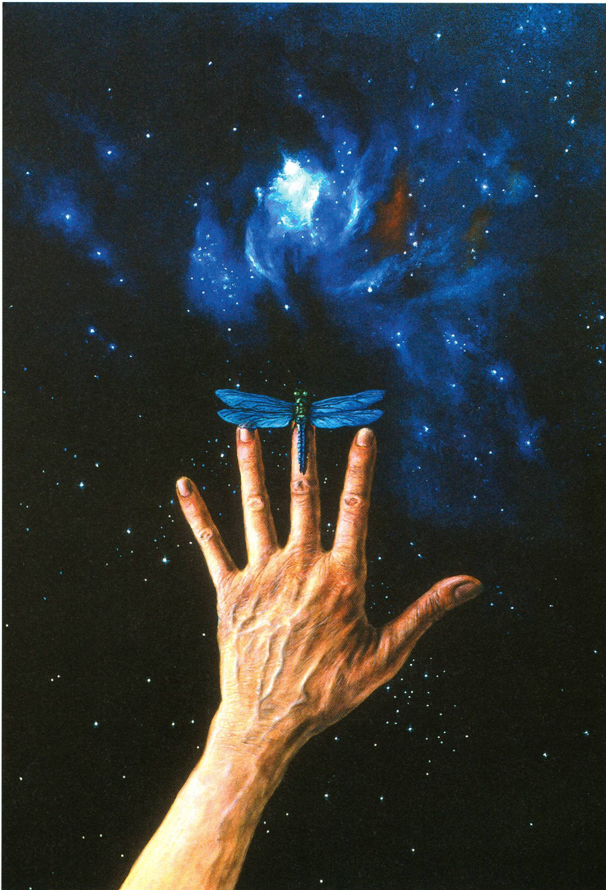
Don de vie (huile de LUDĚK PEŠEK)