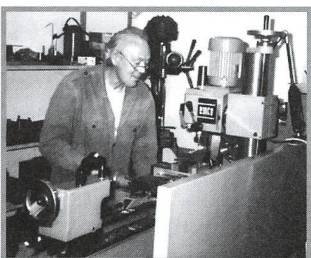
Der Kleinplanet (15077) Edyalge - 45

ORION 300 - Grusswort des Präsidenten - DIETER SPÄNI 4