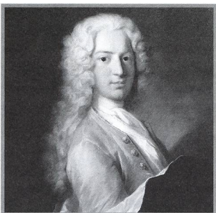
DANIEL BERNOULLIS Beiträge zur Astronomie - 25