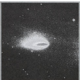
Himmelsdrama in der Abenddämmerung - 43