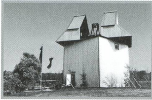
Die Sternwarte Melle - ein Projekt der Expo 2000 - 8