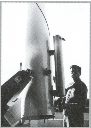
25 Jahre Stiftung Jurasternwarte Grenchen - 16