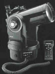
ETX 125 EC