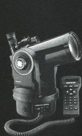
ETX 90 EC

Bis zu 45% Rabatt auf den bekanntesten Marken. Jusqu'à 45% de réduction sur les plus grandes marques.