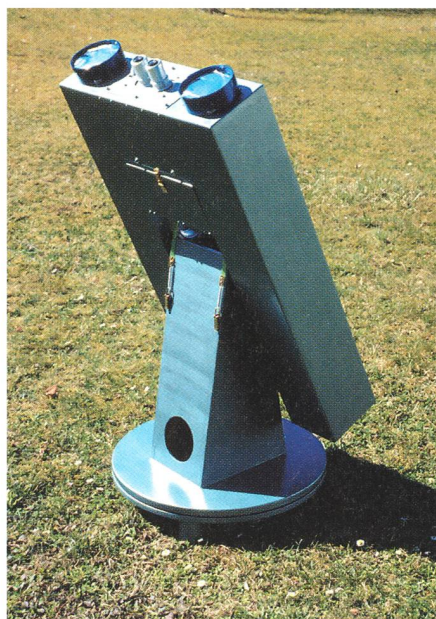
Das 11.5 cm-Binokular, hier bereit zur zweiäugigen Sonnenbeobachtung.

Okularsortiment um je zwei orthoskopische Okulare mit 9 bzw. 25 mm Brennweite erweitert. Ein handelsüblicher Reflexsucher hilft beim Einstellen der Objekte. Die Ausrüstung wird mit einem Satz aufsteckbarer Aluminiumringe mit Sonnenfilterfolie vervollständigt. Zusammen mit passenden Schutzkappen aus Karton verschliessen sie das Teleskop bei Nichtgebrauch. Eine sinnvolle Ergänzung wären ferner zwei leichte, aufsteckbare Rohre als Abschirmung des Strahlengangs gegen die vom Beobachter aufsteigende warme Luft.