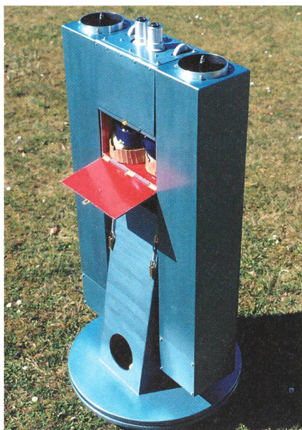
Feldstecher einmal anders: Das fertige 11.5 cm-Binokular.