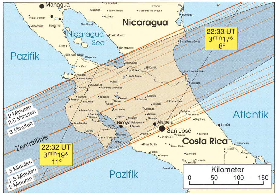
Figur 1: Verlauf der ringförmigen Sonnenfinsternis am 14. Dezember 2001 über Mittelamerika. (Grafik: THOMAS BAER)

Im landberührenden Abschnitt Nicaraguas und Costa Ricas kommen nur die grösseren Orte San José, Alajuela und Nicoya in die Ringförmigkeitszone zu liegen, wobei letztere Station mit 2 min