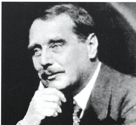
Fig. 2.: Herbert George Wells (1866-1946).

Quant à HERBERT G. WELLS (Fig. 2), il fut certes romancier, mais aussi journaliste, sociologue et historien populaire.