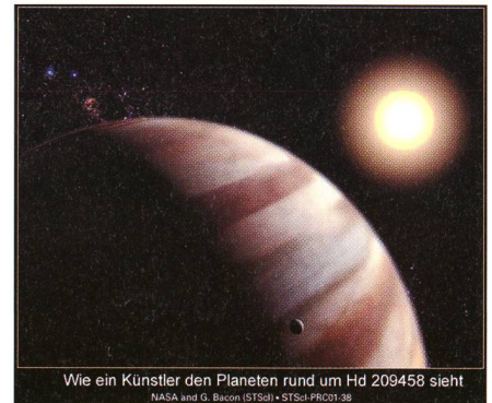
Fig. 1: Der Planet in der Sicht des Künstlers.

Bei dieser prekären Distanz zum Heimatstern wird die Atmosphäre des Planeten auf rund 1100 Grad Celsius aufgeheizt. Trotzdem ist der Planet gross genug, um seine kochende Atmosphäre festzuhalten.