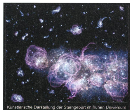
Fig. 1: Entstehung der ersten Sterneneration aus Künstlersicht.

Die Dämmerung des Lichts, die sogenannte «Kosmische Renaissance», begann, als Wasserstoff in kleinen Gebieten zu kollabieren begann und den Punkt überschritt, an dem unter dem Einfluss der Gravitation die Kernfusion zündete und so die ersten Sterne bilde-