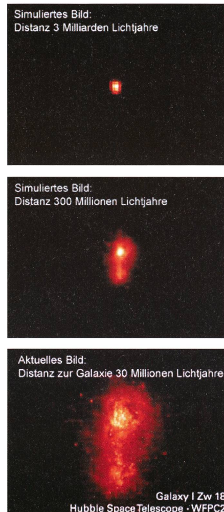
Bild 2: Galaxien, wie sie aus unterschiedlichen Distanzen aussehen.