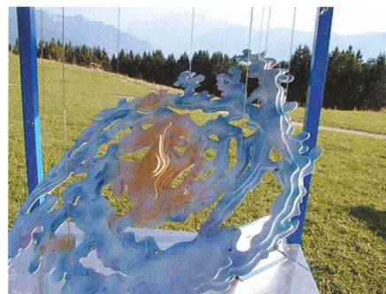
Notre galaxie: la voie lactée. Unsere Galaxie: die Milchstrasse.

Le parcours est jalonné d'écrêteaux en français et en allemand. Mais si le visiteur veut dépasser le niveau du simple curieux, nous lui recommandons d'acheter pour le prix modique de fr. 4.- le Guide du Parcours Claude Nicollier . Cette brochure le conduira pas à pas, elle l'invitera à procéder à des observations et à des manipulations simples; elle l'aidera aussi à se poser les bonnes questions. On peut la trouver à l'entrée du parcours, au restaurant des Pléiades et à la gare de Blonay.