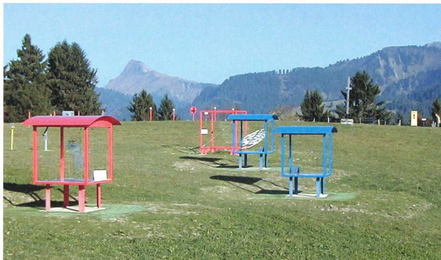
Vue d'ensemble du site. Gesamtansicht der Anlage.

Une idée originale de ce parcours est qu'on s'y réfère toujours à une même base sur le terrain: la distance entre les Pléiades et un sommet bien connu des Alpes de Savoie, le Grammont, distant de 15,6 km. En passant d'une station à l'autre, on change d'échelle. Un triple saut astronomique transporte le visiteur, des prairies de notre environne-