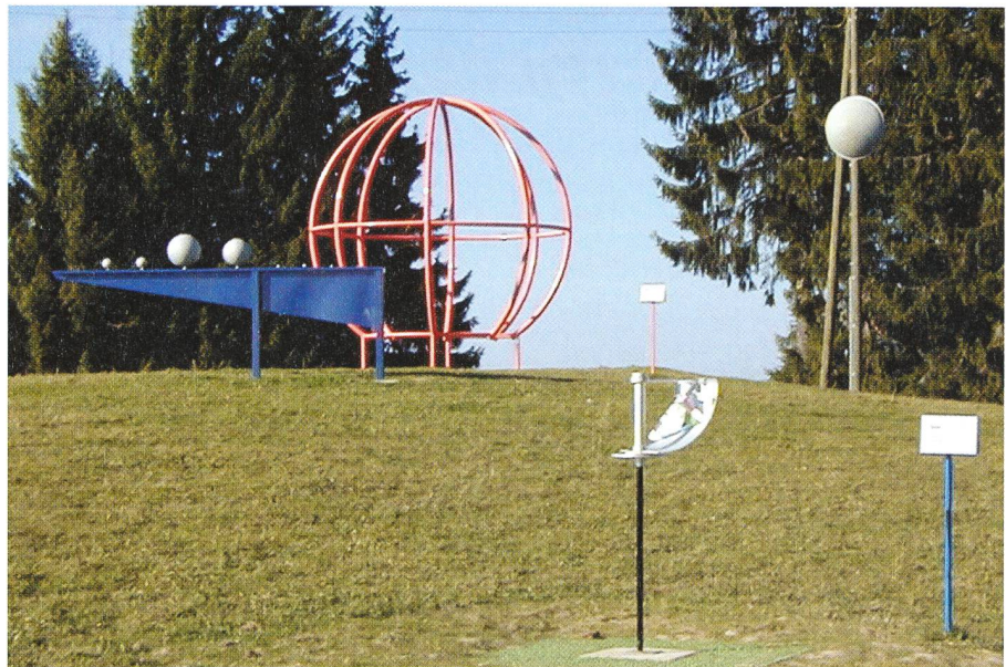
Le quadrant solaire et, au second plan, le Système Solaire. Der Sonnen-Quadrant und, im Hintergrund, das Sonnensystem.

Observatoire de Genève, CH-1290 Sauverny