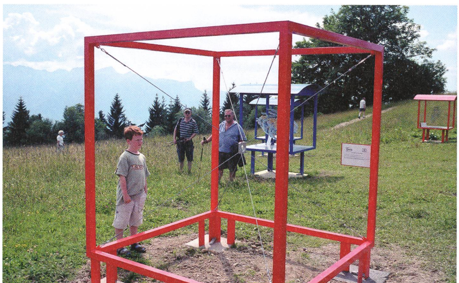
200 milliards d'étoiles, cela veut dire quoi? A cette question répond le modèle «Le sable de Jordanie».