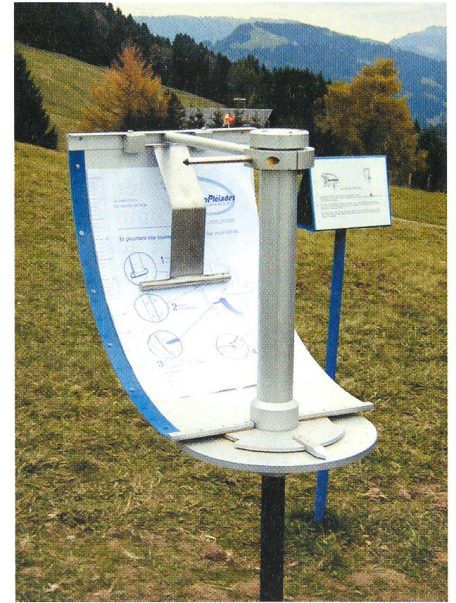
Le quadrant solaire. Der Sonnen-Quadrant.

Observatoire de Genève, CH-1290 Sauverny