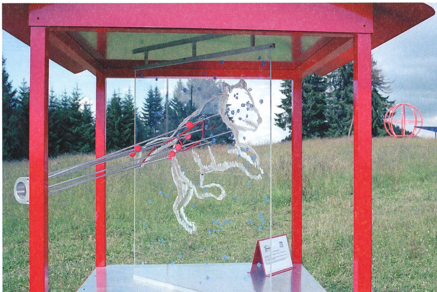
La Grande Ourse. Der Grosse Bär.

Der Rundgang erlaubt der Besucher-schaft, fundamentale Kenntnisse in der Astronomie zu erlangen. Entdecken Sie