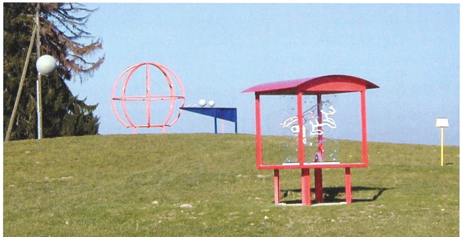
Le modèle «La Grande Ourse» avec, au second plan, «Le Système Solaire». Ein Modell des Grossen Bären, und im Hintergrund das Sonnensystem.