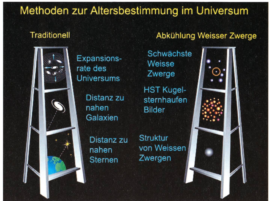
Fig. 4: Methoden der Altersbestimmung des Universums.

Durch frühere Hubble-Beobachtungen gelang es, basierend auf der Expansionsrate des Universums, das Alter auf