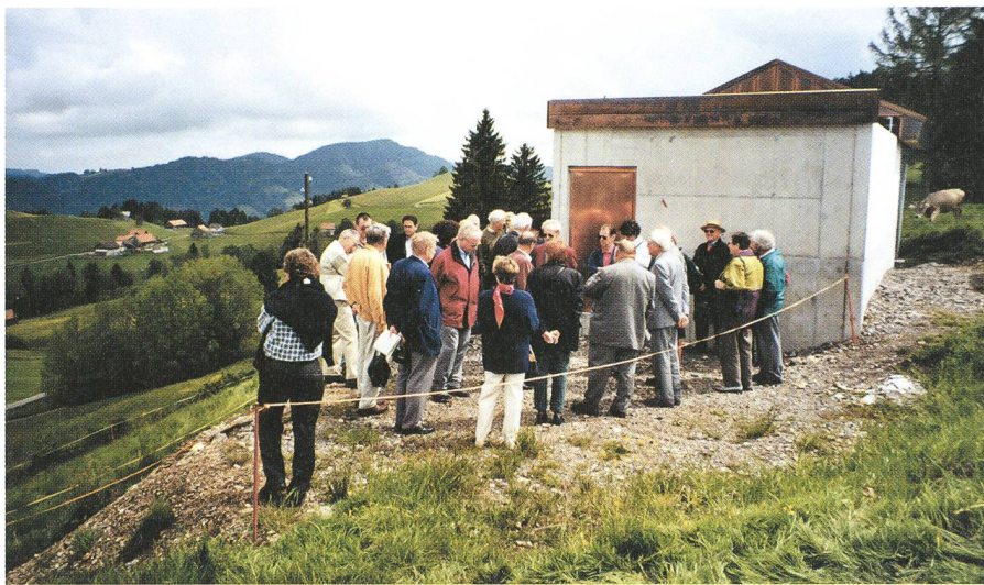
Erste Erklärungen vor der Sternwarte

Der harte Kern der SAG, ein paar Unentwegte, reiste wie üblich schon im Laufe des Freitags an. Jeder benutzte die Zeit für sich um Wattwil, den Gastgeberort, etwas näher kennen zu lernen. Für Einige war es nämlich das erste Mal, dass sie im Toggenburg waren. Am Abend traf sich dann die Vorhut im Restaurant zum Essen und natürlich für erste Gespräche.