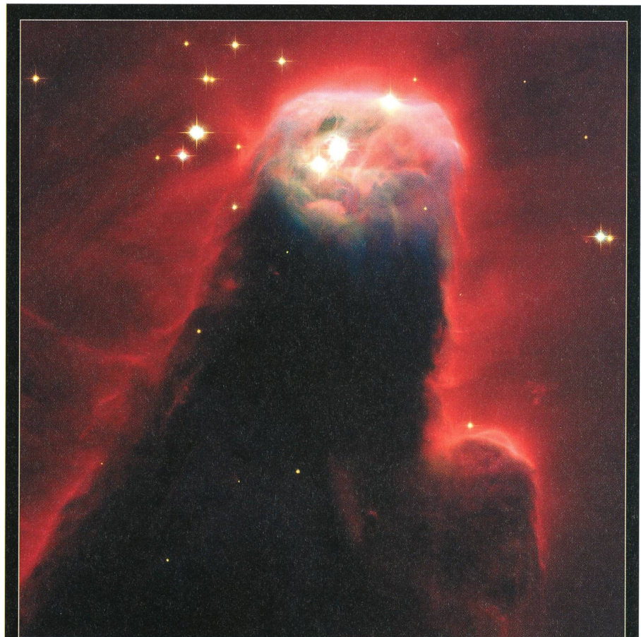
Cone Nebula Hubble Space Telescope • Advanced Camera for Surveys

onen nichts aussergewöhnliches. Die Astronomen vermuten, dass solche Pfeiler die Brutöfen für die Entwicklung von Sternen sind.