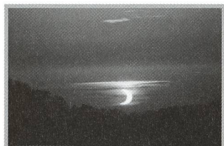
Partielle Sonnenfinsternis vom 31. Mai 2003 - 29