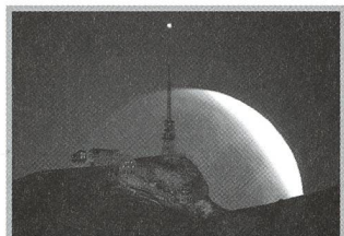
Mondfinsternis vom 16. Mai 2003 - 28