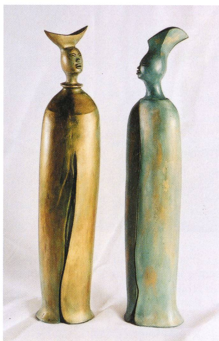
Fig. 12a et 12b – Grands êtres.