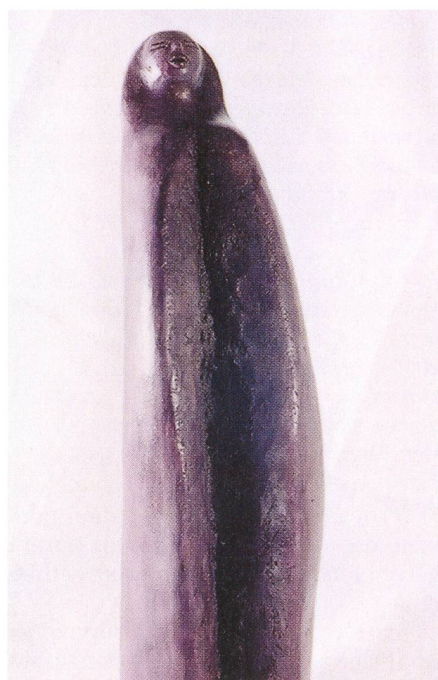
Fig. 11 – Convolution.