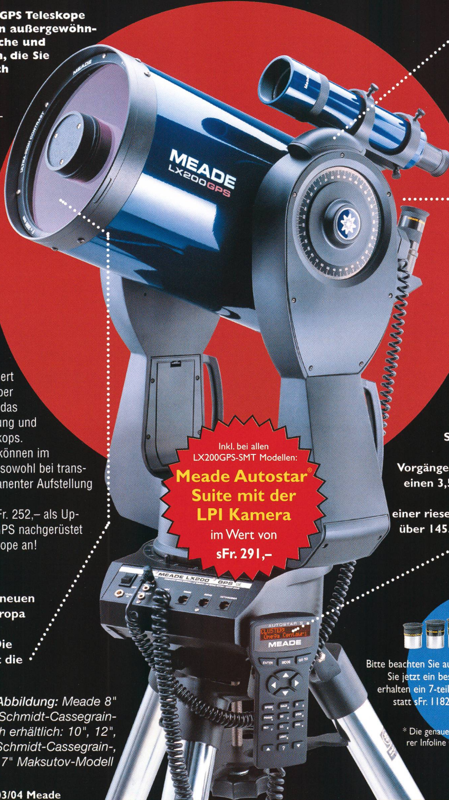
Abbildung: Meade 8" LX200GPS Schmidt-Cassegrain-Teleskop. Auch erhältlich: 10", 12", 14" und 16" Schmidt-Cassegrain-, sowie 7" Maksutov-Modell

Inkl. bei allen LX200GPS-SMT Modellen: Meade Autostar® Suite mit der LPI Kamera im Wert von sFr. 291,-