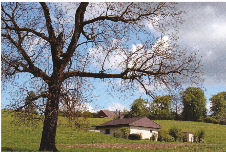
Die Sternwarte Eschenberg liegt in einer Landwirtschaftszone mitten im Winterthurer Stadtforst.

Mit einem Gesamtbudget von gerade mal 65 000 Franken und dazu mit über 2000 im Frondienst geleisteten Arbeitsstunden realisierte die Astronomische Gesellschaft Winterthur 1979 die Sternwarte Eschenberg. Das ursprünglich sehr einfach eingerichtete und bis heute rein ehrenamtlich betriebene Observatorium hat sich zu einer etablierten Institution im regionalen Kultur- und Bildungsangebot und zugleich zu einer international anerkannten Beobachtungsstation für erdnahe Asteroiden und Kometen entwickelt.