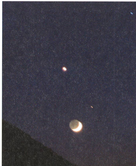
Fig. 1: Venus und Mond über dem Monte San Giorgio und dem Luganersee, aufgenommen von Melano (45° 56' nördlicher Breite) Richtung West-Nordwesten, 14. Mai 2002, 21:20 Uhr. Ektachrom 200 Professional, Nikon F-301, 60 mm Objektiv.

Fig. 2: Venus und Mond im Orion (siehe Text). 14. Mai 2002, 21:25 Uhr. Ektachrom 200 Professional, Nikon F-301, 105 mm Objektiv.