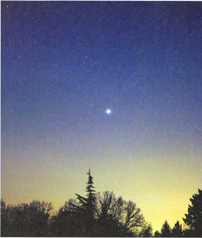
Vénus, les Pléiades et Mars le 30 mars 2004. Sony DSC-F707, 8 sec. de pose.