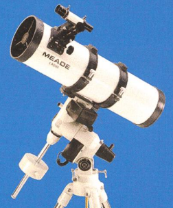
6" Newton mit elektron. Handsteuerbox (ohne AutoStar-Suite)