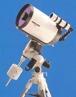
8" Schmidt-Cassegrain mit AutoStar