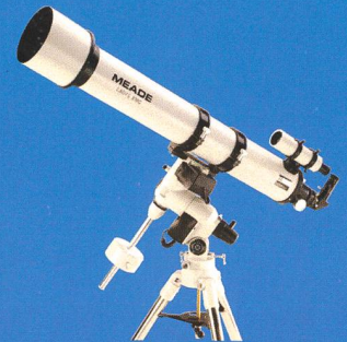
5" und 6" achromatische Refraktoren mit AutoStar