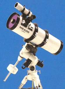
6", 8" und 10" Schmidt-Newton mit AutoStar