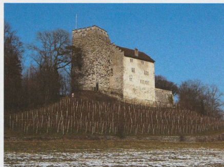
Fig. 3. Die Reste der etwas in Vergessenheit geratenen Stammburg des berühmten Fürstengeschlechts lassen ihre einstige Grösse und Bedeutung nur noch erahnen.

Und was meinen wohl die adeligen Habsburger zu dieser hübschen Geschichte? Das stolze Geschlecht hat schon sehr früh seine Stammburg verlassen und kam erst vom fernen Wien aus zu Macht, Ruhm und Ehre. Doch ganz ist der Faden zu den Ursprüngen nie gerissen: Etwa 30 Kilometer südöstlich der Burg liegt nämlich das bereits