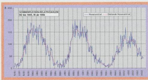
Sonnenfleckensbeobachtungen von blosserem Auge über 3 Zyklen - 11