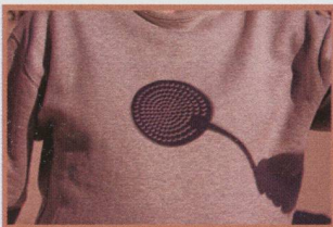
Eclipse annulaire du 3 octobre 2005 - 22