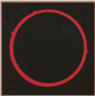
Ringförmige Sonnenfinsternis am 3. Oktober 2005 - 26