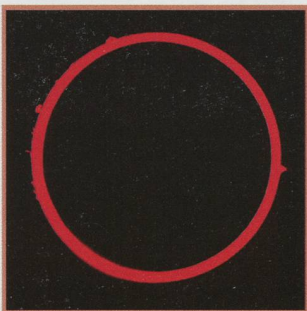
Ringförmige Sonnenfinsternis am 3. Oktober 2005 - 26