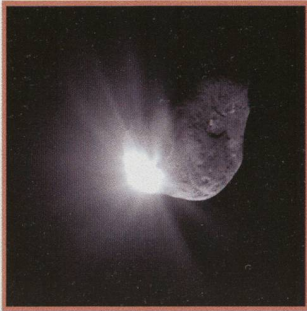
Schuss auf Komet Tempel I - 11