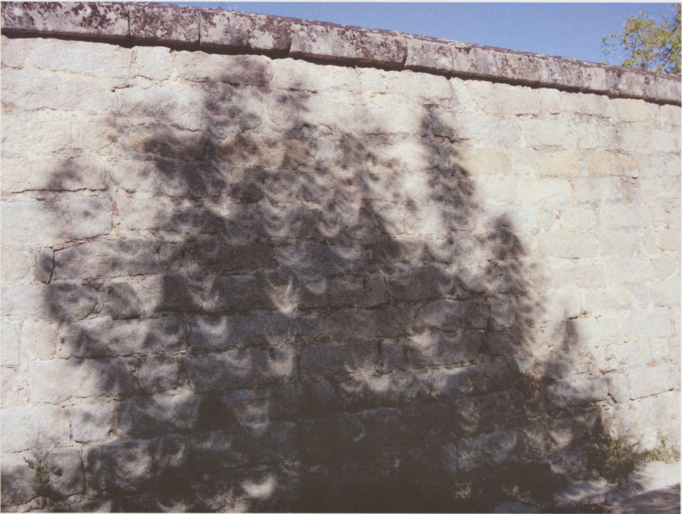
Ombres lors de l'éclipse de Soleil du 3 octobre 2005 à San Lorenzo de El Escorial.