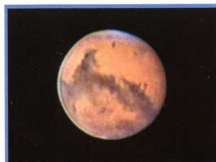
Aktuelles am Himmel: Der rote «Stern» - 28