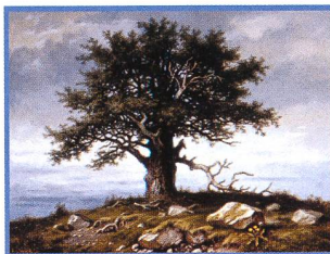
Ludek Pesek – Realist und Visionär - 10