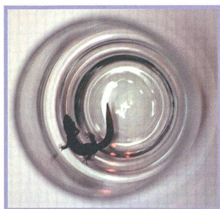
Photométrie au Chili Photos souvenirs - 2 e partie - 4