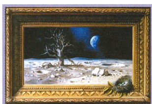
LUDEK PESEK – Realist und Visionär - Teil 3 - 10