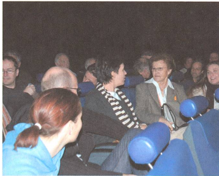
Gespanntes Warten auf den Beginn der Vorführung.

Zum Glück sah es dann am Samstag Nachmittag viel besser aus. Bereits gegen 16:00 Uhr waren schon mehr als 140 Ticketreservierungen abgeholt worden, und schliesslich war bei Beginn der Vorführung das Planetarium fast vollständig gefüllt.