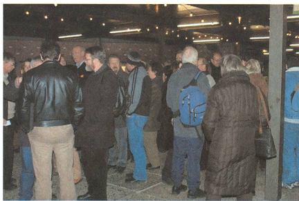
Grosses Gedränge vor dem Verkehrshaus.

Um 17:00 warten 205 gespannte Zuschauer aus der ganzen Schweiz in den bequemen Stühlen auf den Beginn der Vorstellung. Mit einer aus astronomischer Sicht völlig bedeutungslosen kleinen Verspätung von 10 Minuten beginnt um 17:10 Uhr die Vorführung.