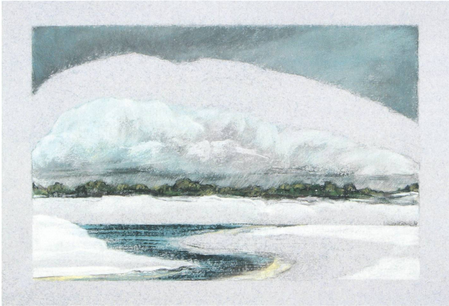
5. Dunes sous la Tempête (Conté Crayon sur papier pastel gris). (© ELIZABETH BOHLEN, cliché AL NATH)