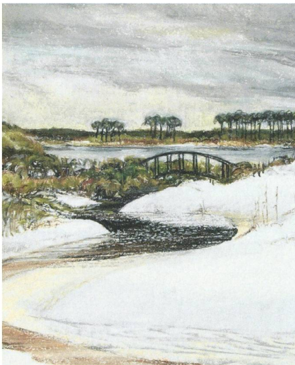
6. Dunes de Floride (Conté Crayon sur papier pastel blanc, env. 19cm x 24cm). (© ELIZABETH BOHLEN, cliché AL NATH)

présentation pour l'Amérique du Nord de la base Simbad du Centre de Données astronomiques de Strasbourg 2 .