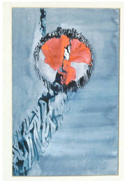
7. Cerf-volant dans l'Arbre (aquarelle, env. 18cm x 27.5cm). (© ELIZABETH BOHLEN, cliché AL NATH)

Ses techniques artistiques sont variées. Ainsi, le Conté Crayon rend magnifiquement les paysages comme l'effet des nappes de brouillard bas dans la Fig. 3 ou les dunes de Floride dans la