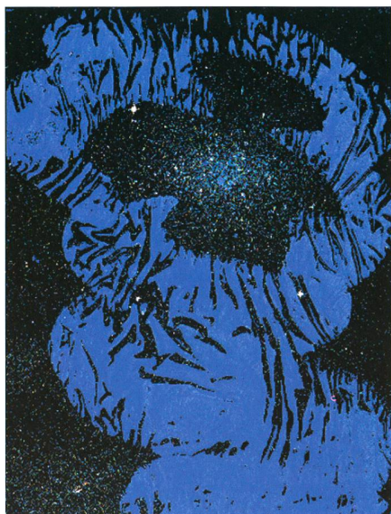
1. Étreinte Céleste (encre, spray et collage, env. 21.5cm x 28cm). (© ELIZABETH BOHLEN)

Quelque chose remua dans les feuilles mortes, troublant le silence de la nuit noire. Assis sur une souche d'arbre en bordure du bois, le jeune homme y prêta à peine attention. Plongé dans ses réflexions, le regard tourné vers le ciel dégagé, il suivait les détails de la Voie Lactée. Ses yeux bien accoutumés à l'obscurité y distinguaient sans peine les étoiles les plus faibles. Ces profondeurs cosmiques étaient pour lui à la fois un refuge et un épanchement. Il venait souvent s'y ressourcer, un peu à l'écart de ce village arriéré où il n'était pas compris.