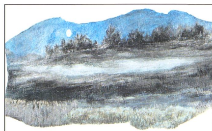
3. Brouillard Bas (Conté Crayon, env. 26.5cm x 16.5cm).

Il leva les bras au ciel avec un soupir profond dans une sorte d'incantation. Si c'était en effet là sa mission, la tâche ne serait pas facile. Et d'où qu'elles puissent venir, toutes les grâces célestes ne seraient pas de trop pour l'aider à porter ce message de savoir et de compréhension. Mais à son modeste niveau, il contribuerait peut-être ainsi à rendre le monde un peu meilleur.