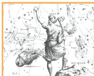
Le Bouvier Salvateur - 26