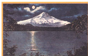
Les potins d'Uranie Ya-hoh - 25