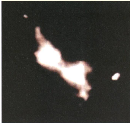
Fig. 2: La Nébuleuse Bikini.