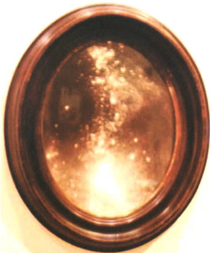
Fig. 1: Fusion de jeunes étoiles dans Cassiopée, par la photographe-astronome inexistante Anabella Gaposchk.

Quelques «oeuvres» sont présentées en ces pages, notamment la Nébuleuse Bikini qui devrait alerter les visiteurs attentifs de l'exposition puisque le bikini est né beaucoup plus tard 1 . Les images sont fabriquées par dispersion de farine, de sucre et d'autres ingrédients culinaires. Les cadres sont d'époque victorien-