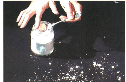
Fig. 5: Fabrication de fausses photographies astronomiques par saupoudrage de farine.