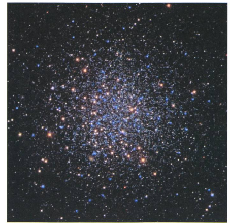
4. L'amas NGC5466 de la constellation du Bouvier.

La plupart des observateurs du ciel connaissent son étoile la plus brillante, Arcturus, de magnitude apparente visuelle -0,04 et de type spectral K1.5III –