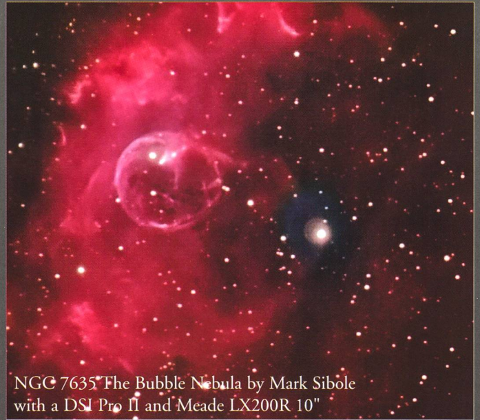
NGC 7635 The Bubble Nebula by Mark Sibole with a DSI Pro II and Meade LX200R 10"