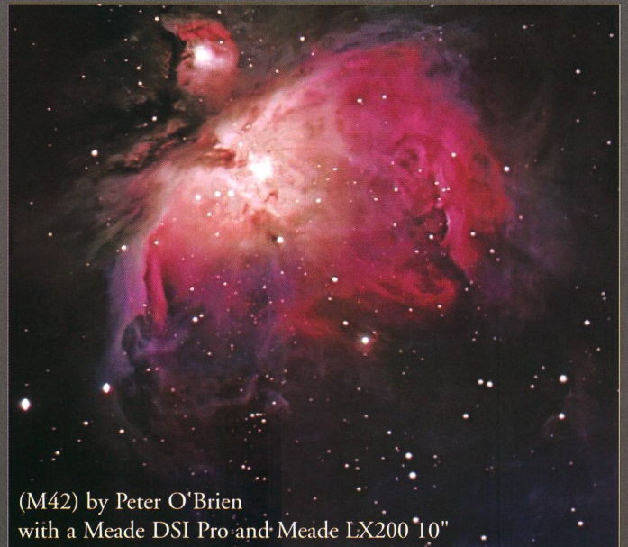
(M42) by Peter O'Brien with a Meade DSI Pro and Meade LX200 10"

Der Deep Sky Imager II verbindet einfache Handhabung mit einem größeren Sensor, größerer Empfindlichkeit, höherer Auflösung und stark reduziertem thermischen Rauschen. Die Meade-Ingenieure haben eine bemerkenswerte Lösung gefunden, wie ohne den Einsatz aufwendiger aktiver Kühlung das thermische Rauschen reduziert werden kann. Hierdurch können nun auch Einzelbelichtungen mit sehr langen Belichtungszeiten durchgeführt werden. Neue Temperatursensoren passen den Bildern automatisch die richtigen Dunkelbilder an, so daß es nahezu unmöglich ist, unkalibrierte Aufnahmen zu machen. Die Software beinhaltet eine neue Zoomfunktion für einfacheres Fokussieren und die quadratischen Pixel des größeren Chips sorgen für einfachere Bearbeitung und ästhetischere Bilder als bisher. Der DSI II ist die erste ungekühlte Kamera mit geringem thermischen Rauschen. Und das ist so cool, wie es sich anhört!