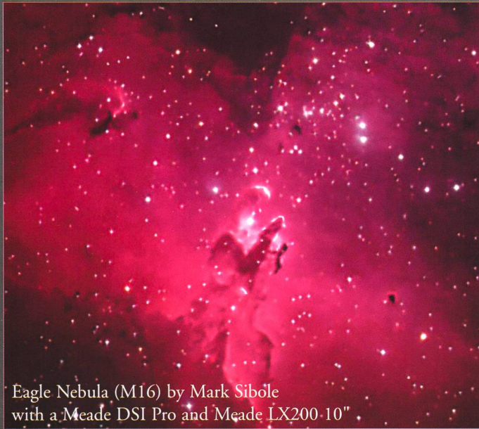
Eagle Nebula (M16) by Mark Sibole with a Meade DSI Pro and Meade LX200 10"