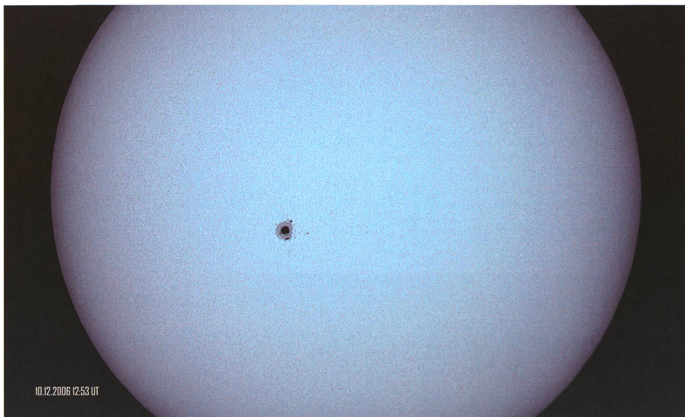
Abb. 2: Sonnenphotosphäre aufgenommen am 10. Dezember 2006 um 12:53 UT auf dem Uechter Sonnenturm in Niedermuhlern mit einer Canon EOS 300D Digitalkamera an einem Meade LX200 GPS Schmidt-Cassegrain Refraktor. Lichtdämpfung mit Baader Astro-Solar Sonnenfilterfolie. Belichtungszeit 1/200 sec. Bildbearbeitung in MaxIm DL.

Fotografia scattata il giorno 11 dicembre 2006 alle 08:05 da Roncapiano (Ticino). Si tratta del Sole all'alba con una magnifica macchia al centro. Telescopio: lichtenknecker optics a.g. 11 cm, f/15 al fuoco diretto. Apparecchio fotografico digitale: Canon EOS 20DA. Esposizione: 1/200 sec. Sensibilitr': ISO-100. Filtro: nessuno