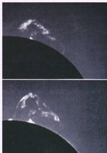
Fig. 2. Eruptive Protuberanz vom 1. Juni 1968; oben 06:45h, unten 07:45h; aufgenommen mit dem Protuberanzfernrohr, 80 mm Öffnung, 1220 mm Brennweite.