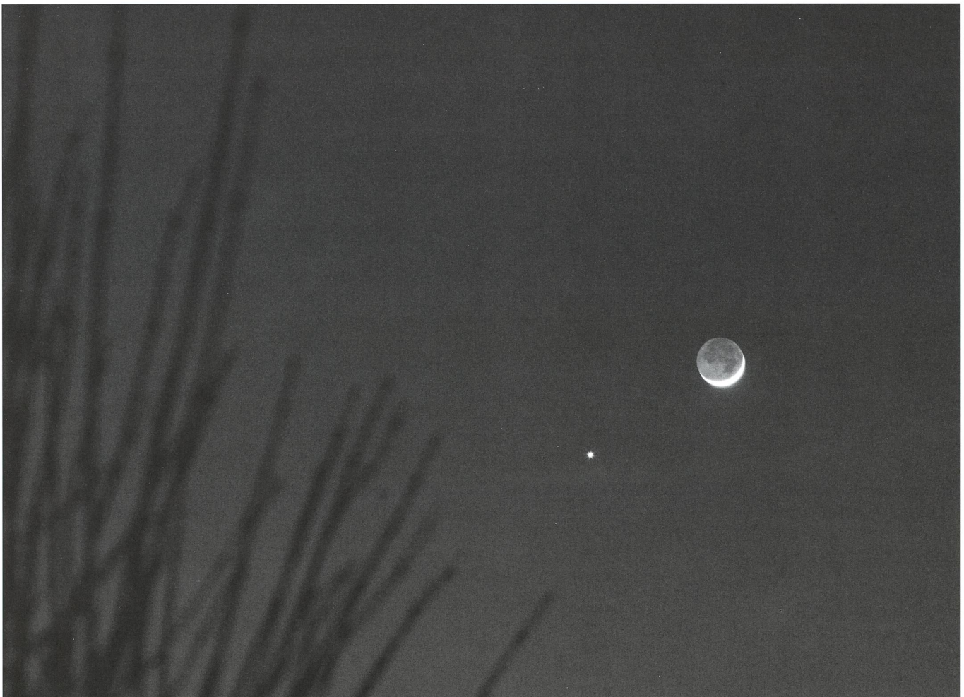
Die schlanke zunehmende Mondsichel wanderte am 19. Februar 2007 nahe an Venus vorbei.