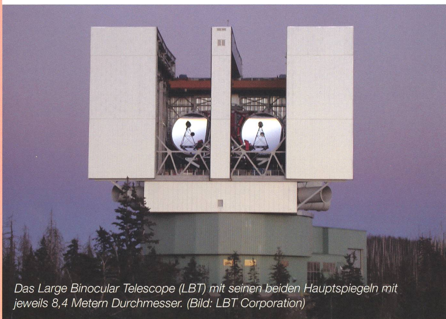
Das Large Binocular Telescope (LBT) mit seinen beiden Hauptspiegeln mit jeweils 8,4 Metern Durchmesser.

Auf dem 3190 Meter hohen Mount Graham in Arizona steht das weltgrößte Einzelteleskop, das Large Binocular Telescope (LBT). Zwei riesige Spiegel mit 8,4 Metern Durchmesser befinden sich auf einer gemeinsamen Montierung und machen das Instrument zu einem gigantischen Fernglas. Durch die Kopplung der Strahlengänge beider Einzelspiegel sammelt das LBT in seiner endgültigen Konfiguration so viel Licht, wie ein Fernrohr mit einem Hauptspiegel von 11,8 Metern Durchmesser. Das Lichtsammelvermögen übertrifft dasjenige des Weltraumteleskops Hubble um das 24-fache. Die Auflösung erreicht die eines 22,8-Meter-Teleskops, denn es verfügt über die modernste Adaptive Optik und die Bilder der Einzelspiegel können interferometrisch zu einem Gesamtbild überlagert werden. Die Astronomen sind damit in der Lage, die durch die Luftunruhe verursachte Unschärfe erdgebundener Aufnahmen zu kompensieren. Mit dieser Leistungsfähigkeit wird das LBT völlig neue Möglichkeiten zur Erforschung von Planeten ausserhalb des Sonnensystems und zur Untersuchung der schwächsten und am weitesten entfernten Galaxien bieten.