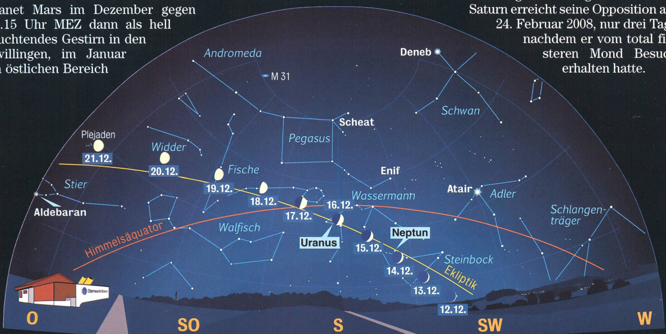
Anblick des abendlichen Sternenhimmels Mitte Dezember 2007 gegen 17.45 Uhr MEZ (Standort: Sternwarte Bülach)

Interessant wird im Laufe des neuen Jahres die ändernde Sicht auf das Saturn-Ringsystem sein. Langsam aber sicher nähern wir uns der Ringkantenansicht, womit wir bereits Ende 2008 vom berühmten Wahrzeichen fast nichts mehr sehen. Anfang September 2009 kreuzt dann die Erde die Ringebene Saturns einmal, womit uns der Planet vorübergehend ringlos erscheint. Saturn erreicht seine Opposition am 24. Februar 2008, nur drei Tage nachdem er vom total finsternen Mond Besuch erhalten hatte.