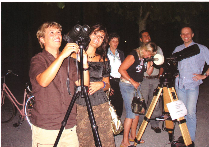
^ Mit Fernrohr und Feldstecher zu den Leuten – Mit der «Sidewalk-Astronomy» hat man in Luzern positive Erfahrungen gemacht.

Die gesellschaftlichen Bedürfnisse verändern sich rasend schnell. Das Freizeitangebot ist riesig, was auch wir in den öffentlichen Sternwarten zu spüren bekommen. Neue Ideen sind gefragt, wie die Astronomie unter die Leute zu bringen ist. Die «Bürgersteig-Astronomie» könnte hierzu ein gutes Rezept sein.