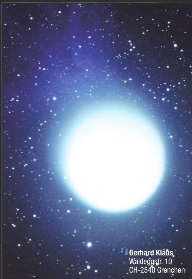
Gerhard Kläus, Waldeggstr. 10 CH-2540 Grenchen

In der Aufnahme rechts von Gerhard Klaus ist der Kometenkopf überstrahlt. Dafür zeigt sich um ihn herum ein ausgeglichener schwacher Halo und in Richtung Südwest der Ansatz eines blauen zerzausten Ionenschweifs. Das Bild entstand in Puimichel in der Haute Provence mit einer Canon EOS 350D an einem 20-cm-Newton f/5 + Baader Komakorrektor. Belichtet wurde es 4 x 4 Minuten bei ISO 800. Aus einer Entfernung von 1.62 AE (242 Millionen Kilometer) und einem Winkeldurchmesser von 21 Bogenminuten ergibt sich für den Kometenkopf ein linearer Durchmesser von 1.48 Millionen Kilometern, was angenähert demjenigen der Sonne entspricht. Auch bei der obigen Aufnahme von Alberto Ossola, die er in der dunklen Leventina schoss, ist ein Schweifansatz deutlich erkennbar.