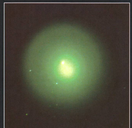
Der Kernbereich zeigt einen helleren Jet, der sich von uns weg in den Raum erstreckt.