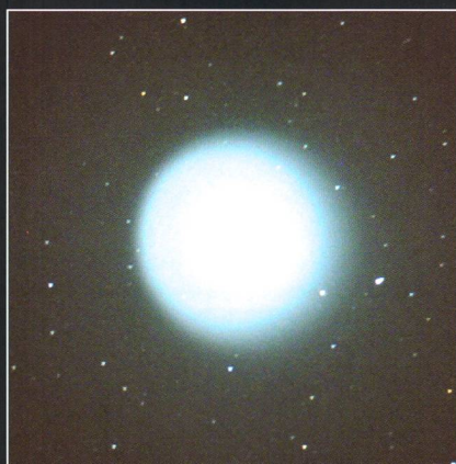
Komet Holmes glich einem überdimensionierten Planetarischen Nebel.