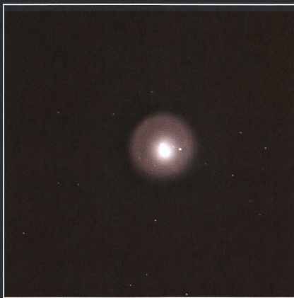
Diese Aufnahme zeigt den Kometen Holmes am Abend des 28. Oktober 2007.