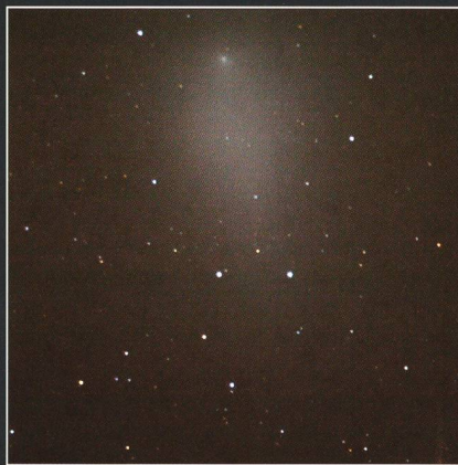
Am 17. November 2007 hat sich die Kometenkoma um ein Vielfaches ausgedehnt.

Die Vergleichsfotos zeigen die Entwicklung des Kometenkopfs im Detail. Das linke Bild entstand am 28. Oktober 2007 aus 16 Aufnahmen à 8 Sekunden im Primärfokus eines Meade 2080 (8" SC mit Brennweite 2 m) und einer Canon 350d bei 1600 ASA. Das rechte Bild zeigt den Kometen drei Wochen später. Er hat bei gleicher Brennweite fast keinen Platz mehr im Gesichtsfeld. Die rechte Aufnahme wurde abgesehen vom Belichtungsverfahren (3 Aufnahmen à 30 Sekunden) unter gleichen Bedingungen aufgenommen.