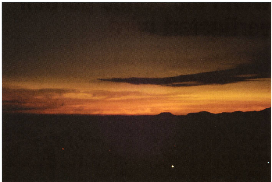
Figur 2: Am 11. Juli 1991 fand über Baja California mit einer Totalitätsdauer von fast 7 Minuten eine ausgesprochen lange Sonnenfinsternis statt. Die beiden Fotos entstanden vor und während der totalen Phase und zeigen, wie stark die Landschaft abgedunkelt wurde.

können aber nur bei einer totalen Sonnenfinsternis ohne spezielle Vorrichtungen gesehen werden.