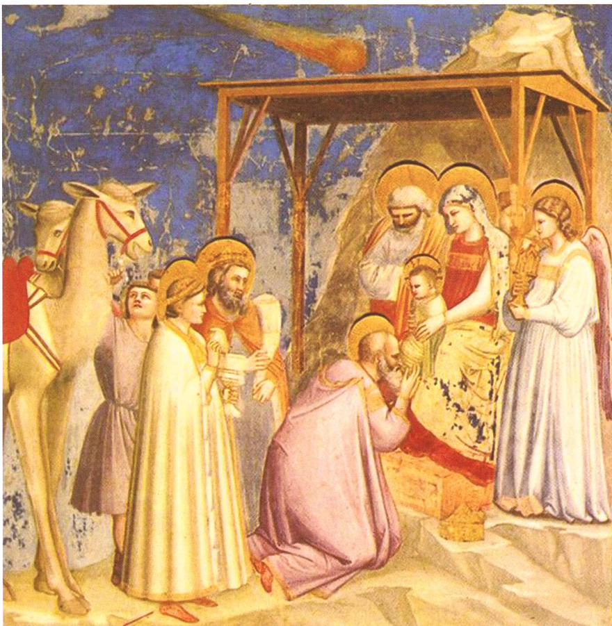
Der Künstler Giotto di Bondone hat im Jahre 1304 den Stern so gemalt, wie er auch heute auf vielen Bildern zu sehen ist; als geschweiften Stern.

Warum wurde Jesus nicht im Jahr Null geboren? Haben wir mit unserer Zeitmessung einen Fehler gemacht oder kam Christus zu früh zur Welt? Und warum zeichnen noch heute die Kinder den legendären Stern von Bethlehem mit einem Schweif, obwohl man längst weiss, dass es sich um eine dreifache Konjunktion des Königsgestirns Jupiter und Saturn im Jahre 7 vor Christus gehandelt haben muss?