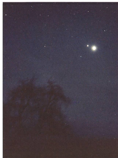
Die letzte Dreifachkonjunktion zwischen Jupiter und Saturn fand 1980/81 statt. Das Bild entstand am 4. März 1981 auf der Sternwarte Eschenberg.