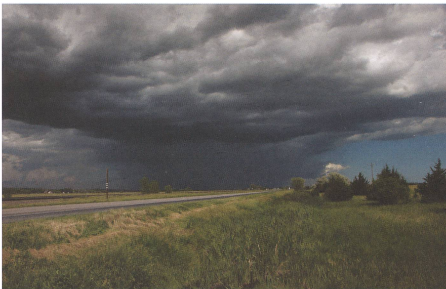
Juin 2008, supercellule LP (low precipitation) dans l'état de l'Oklahoma. Le ciel ne va-t-il pas nous tomber sur la tête ?

casions, nous sommes à deux doigts d'en voir une, mais le phénomène ne se produit pas. Par contre les orages exceptionnels que nous voyons et la grêle sont impressionnants. Le spectacle, même sans tornade, est toujours superbe. Au fil des jours, mes connaissances en météo, jusqu'alors très moyennes, s'améliorent. J'apprends comment fonctionnent ces fameuses supercellules, un système autonome très organisé, qui se forme dans des conditions très précises et évolue dans une atmosphère très cisailée. Je distingue maintenant facilement dans les cumulonimbus cette forme d'en-