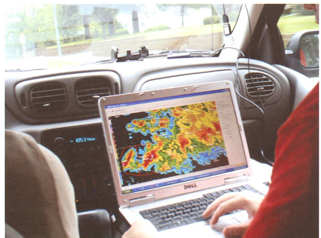
Le navigateur consulte en permanence les cartes et bulletins météo pour connaître l'évolution des supercellules et se positionner dans la zone la plus favorable en cas de tornade.

Départ pour le Kansas, car c'est là, ainsi que dans l'Oklahoma, et le Nord Texas, que les risques de tornades ou, pour nous, les chances d'en voir sont les meilleures. Chaque matin, nos 2 météorologues consultent les différents bulletins et programmes spécifiques pour connaître, avec le plus de précision possible, les zones où les probabilités de formation de supercellules sont les meilleures. Parmi les différents types d'orages, les « supercellules » sont ceux qui génèrent des rafales de vents d'une extrême violence, et forment des grêlons énormes et des tornades dévastatrices et, hélas, parfois meurtrières. Comme par hasard, elles se