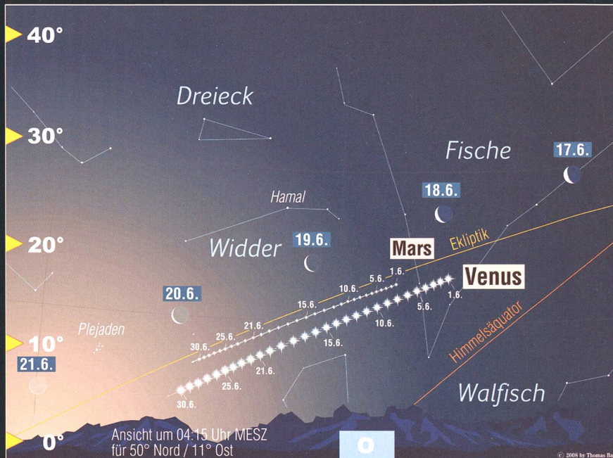
Anblick des morgendlichen Himmels gegen 04:15 Uhr MESZ vom 17. bis 21. Juni 2009. Die Mondsichel zieht an Venus und Mars vorbei. (Grafik: Thomas Baer)

Eigentlich stünde auch Merkur im Juni 2009 recht weit westlich der Sonne, doch wegen der ungünstigen Lage seiner Bahn steigt er vor Sonnenaufgang nur wenig über den Horizont. Seine Helligkeit nimmt im Laufe des Monats jedoch von +2.1 mag auf -0.9 mag zu, womit er gegen den Monatsletzten hin doch noch in der Dämmerung auffindbar wird. Auch tagsüber kann man den flinken Planeten teleskopisch aufspüren. Es ist allerdings grösste Vorsicht wegen der Sonne geboten. Venus strahlt konstant mit -4.2 mag als «Morgenstern» im Osten. Sie geht rund 2 Stunden vor der Sonne auf. Nachdem Venus am 18. April bereits einmal am deutlich lichtschwächeren